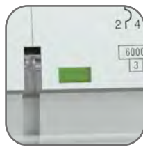
Окно реального состояния контактов с защитой от искр