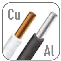
Возможна коммутация алюминиевым и медным проводом