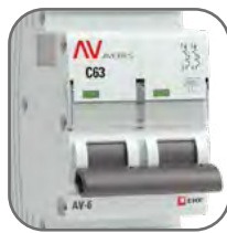
Литая лицевая панель