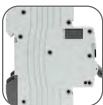
Жесткий корпус, 9 заклепок