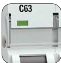
Удобное окно для маркировки цепи