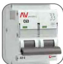
Литая лицевая панель