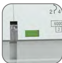
Окно реального состояния контактов с защитой от искр