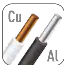
Возможна коммутация алюминиевым и медным проводом