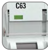
Удобное окно для маркировки цепи