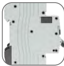
Жесткий корпус, 9 заклепок