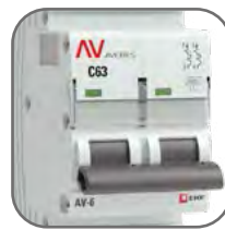
Литая лицевая панель