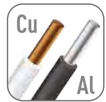
Возможна коммутация алюминиевым и медным проводом