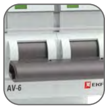
Механизм мгновенной коммутации (ММК)

Выключатели автоматические серии AV-6 EKF AVERES предназначены для оперативно-го управления участками электрических цепей, а также для защиты от токов перегрузки и короткого замыкания в административных, промышленных и жилых зданиях. Выключатели производятся в одно-, двух-, трех- и четырехполюсном исполнении. Номинальная отключающая способность (Icn) 6 кА. Полный набор аксессуаров для расширения функций. Гарантийные обязательства 10 лет.