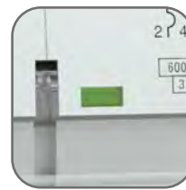
Окно реального состояния контактов с защитой от искр