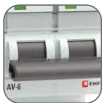
Механизм мгновенной коммутации (ММК)

Выключатели автоматические серии AV-6 EKF AVERES предназначены для оперативно-го управления участками электрических цепей, а также для защиты от токов перегрузки и короткого замыкания в административных, промышленных и жилых зданиях. Выключатели производятся в одно-, двух-, трех- и четырехполюсном исполнении. Номинальная отключающая способность (Icn) 6 кА. Полный набор аксессуаров для расширения функций. Гарантийные обязательства 10 лет.