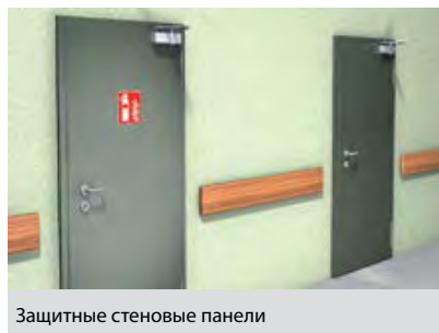
Защитные стеновые панели