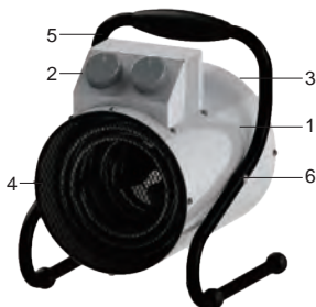
Рис. 1. Устройство прибора

Несущая конструкция тепловентилятора (см. рис.1) состоит из корпуса (1), изготовленного из листовой стали и имеющего цилиндрическую форму. В корпусе размещены вентилятор и трубчатые электронагревательные элементы. Снаружи корпуса расположен блок управления (2). Корпус, закрытый воздухозаборной (3) и воздуховыпускной (4) решетками, винтами устанавливается к ручке-подставке (5) и имеет возможность поворота в вертикальной плоскости. Угол поворота фиксируется винтами (6). Вентилятор затягивает воздух через отверстия воздухозаборной решетки. Воздушный поток, втянутый вентилятором в корпус, проходя между петлями трубчатых электронагревательных элементов, нагревается и подается в помещение через отверстия воздуховыпускной решетки.