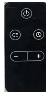
Пульт дистанционного управления