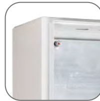
Скошенный желоб препятствует попаданию влаги внутрь