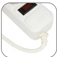
Гибкая втулка предотвращает перетирание шнура в месте соединения провода с колодкой