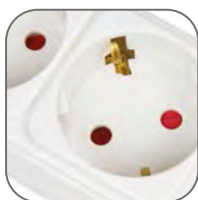
Защитные шторки на всех изделиях