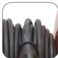
Кабель в резиновой оболочке (КГ). Длина: 30, 40, 50 м