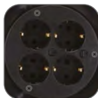
Розеточный блок на четыре гнезда