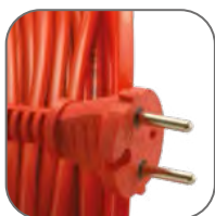
Литая неразборная вилка