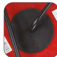
Усиленная шпуля катушки