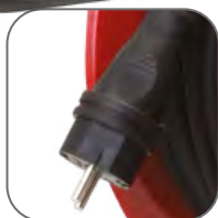
Каучуковая разборная вилка