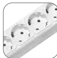
Розетки расположены под углом 45°, что позволяет подключить много потребителей