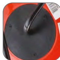
Усиленная шпуля катушки