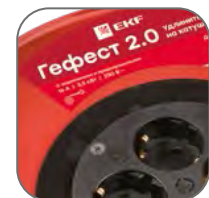
Катушка из металла толщиной 0,8–0,9 мм