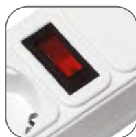
Кнопка «Вкл/Выкл» со светодиодной подсветкой и встроенным предохранителем