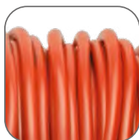
Гибкий надежный проводник ПВС. Длина: 30, 40, 50 м