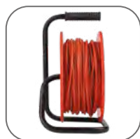
Рама из металлической трубы с резиновой рукояткой

Удлинители «Атлант 2.0» EKF PROxima предназначены для бытового использования – подключения электрических приборов низкой мощности, таких как, например, ручные электрические триммеры, электрические пилы, бытовые насосы. Провод, которым укомплектован удлинитель, рассчитан на мощность до 3,5 кВт (в зависимости от типа изделия и сечения провода), что позволит решить большинство задач, не переплачивая за избыточную мощность.