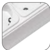
Негорючий материал корпуса ABS-пластик

Сетевые фильтры EKF PROxima предназначены для защиты дорогостоящего электрооборудования от высоко- и низкочастотных помех помех, перегрузок различного типа и коротких замыканий. Спектр оборудования, которое рекомендуется подключать только через сетевой фильтр, включает оргтехнику, аудио- и видеоборудование, компьютеры, большую часть бытовой техники. Использование сетевых фильтров позволяет значительно повысить электро- и пожаробезопасность как рабочего места, так и помещения в целом, а широкий спектр типоразмеров делает использование сетевых фильтров удобным и комфортным.