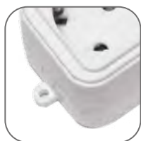
Крепление к стене