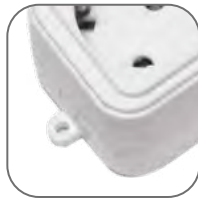
Крепление к стене