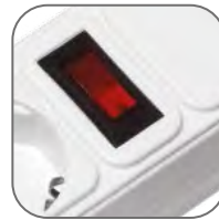
Кнопка «Вкл/Выкл» со светодиодной подсветкой и встроенным предохранителем