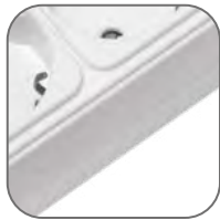
Негорючий материал корпуса ABS-пластик

Сетевые фильтры EKF PROxima предназначены для защиты дорогостоящего электрооборудования от высоко- и низкочастотных помех помех, перегрузок различного типа и коротких замыканий. Спектр оборудования, которое рекомендуется подключать только через сетевой фильтр, включает оргтехнику, аудио- и видеоборудование, компьютеры, большую часть бытовой техники. Использование сетевых фильтров позволяет значительно повысить электро- и пожаробезопасность как рабочего места, так и помещения в целом, а широкий спектр типоразмеров делает использование сетевых фильтров удобным и комфортным.