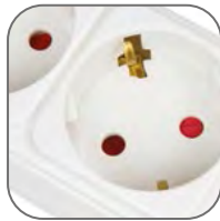
Защитные шторки на всех изделиях