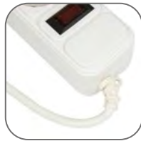
Гибкая втулка предотвращает перетирание шнура в месте соединения провода с колодкой