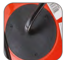
Усиленная шпуля катушки