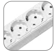
Розетки расположены под углом 45°, что позволяет подключить много потребителей