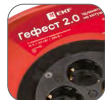
Катушка из металла толщиной 0,8–0,9 мм