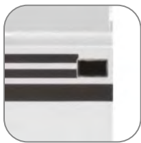
Индикатор состояния контактов