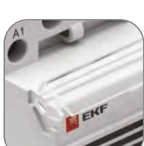
Маркировочная площадка с защитной крышкой