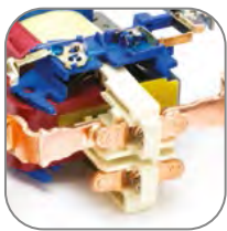
Мостиковый контакт обеспечивает быстрое гашение дуги при коммутации