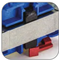
Резиновый демпфер уменьшает шум при работе

Контактор в классическом корпусе модульного оборудования. Состоит из неподвижных контактов, подвижных контактов, которые закреплены в подвижной части магнитной системы. Неподвижная часть магнитной системы закреплена жестко в корпусе KM. Пружина препятствует смыканию контактов. При подаче напряжения на катушку управления в магнитной системе контактора возникает магнитное поле, которое, преодолевая сопротивление пружины, смыкает магнитную систему и замыкает контакты. При отключении напряжения с катушки управления пружина размыкает контакты. Возможна коммутация алюминиевым и медным проводом.