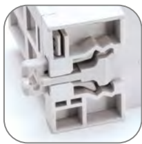
Двухпозиционный зажим на DIN-рейку