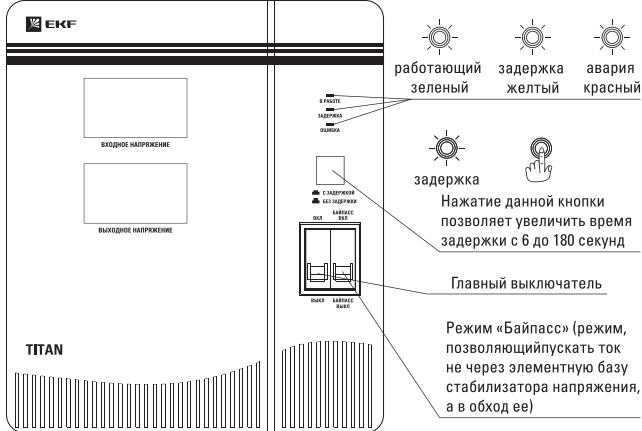
Рис. 3 Внешний вид стабилизатора F-8000/10000/12000