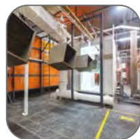
Атмосферостойкая порошковая краска

Щиты с монтажной панелью ЩМП и ЩМПг EKF PROxima являются надежной оболочкой для сборки щитов управления, автоматизации и пунктов распределения. Возможна установка различного модульного и силового оборудования. Сфера применения разнообразна: от жилого сектора до промышленности. Электрощиты изготовлены из российской стали, соответствующей ГОСТ 1050-88. Сборка корпусов осуществляется методом сварки, что обеспечивает их высокую жесткость и герметичность соединения частей. Монтажная панель выполнена съемной, что облегчает процесс монтажа оборудования. Электрощиты защищены от коррозии и разрушающего воздействия погодных факторов благодаря фосфатированию и использованию атмосферостойкой порошковой краски.