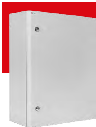
ЩМП г-ХХХ EKF PROxima

Щит с монтажной панелью Герметичный Высота, ширина, глубина