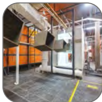
Атмосферостойкая порошковая краска

Щиты с монтажной панелью ЩМП и ЩМПг EKF PROxima являются надежной оболочкой для сборки щитов управления, автоматизации и пунктов распределения. Возможна установка различного модульного и силового оборудования. Сфера применения разнообразна: от жилого сектора до промышленности. Электрощиты изготовлены из российской стали, соответствующей ГОСТ 1050-88. Сборка корпусов осуществляется методом сварки, что обеспечивает их высокую жесткость и герметичность соединения частей. Монтажная панель выполнена съемной, что облегчает процесс монтажа оборудования. Электрощиты защищены от коррозии и разрушающего воздействия погодных факторов благодаря фосфатированию и использованию атмосферостойкой порошковой краски.