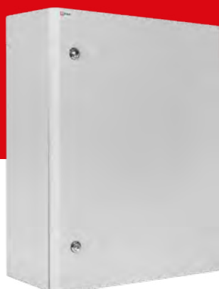
ЩМП г-ХХХ EKF PROxima

Щит с монтажной панелью Герметичный Высота, ширина, глубина