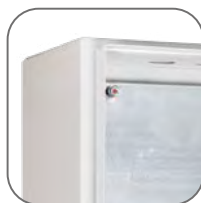
Скошенный желоб препятствует попаданию влаги внутри