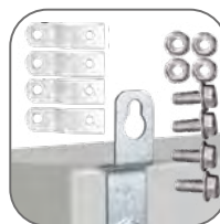
Пластины для навесного монтажа