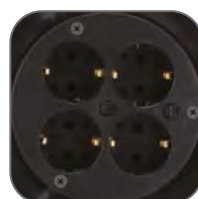
Розеточный блок на четыре гнезда