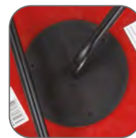
Усиленная шпуля катушки