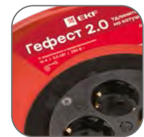
Катушка из металла толщиной 0,8–0,9 мм