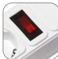
Кнопка «Вкл/Выкл» со светодиодной подсветкой и встроенным предохранителем