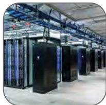
Центры обработки данных, серверные