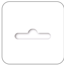
Розничная упаковка в пакете с еврослотом