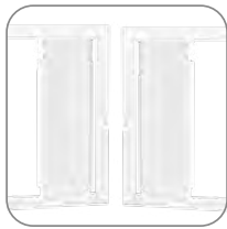
Открывание дверцы с правой или левой стороны