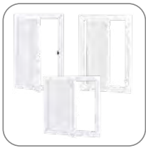
3 варианта исполнения люков

Люки ревизионные применяются для обеспечения оперативного доступа к установленному в нише сантехническому, электротехническому и иному оборудованию. Изготавливаются из пластика и стали. Люки из стали окрашены порошковой краской в белый цвет. На дверце предусмотрен паз для удобного открывания люка. Люки пластиковые изготовлены из пластика белого цвета. Дверца открывается нажимным способом. Люки пластиковые с нажимным замком изготовлены также из пластика, но открытие дверцы производится путем нажатия на замок. Дверца фиксируется в закрытом состоянии при помощи нажимного замка. Габаритный размер, указанный в названии и артикуле продукции, – это габарит по внутренней рамке, монтируемой в нишу.