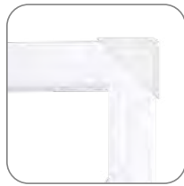
Транспортировочные уголки для металлических люков