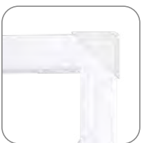
Транспортировочные уголки для металлических люков