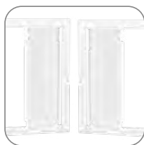
Открывание дверцы с правой или левой стороны