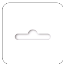
Розничная упаковка в пакете с еврослотом