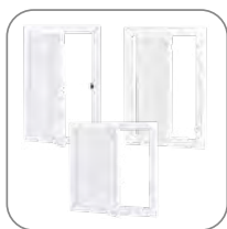
3 варианта исполнения люков

Люки ревизионные применяются для обеспечения оперативного доступа к установленному в нише сантехническому, электротехническому и иному оборудованию. Изготавливаются из пластика и стали. Люки из стали окрашены порошковой краской в белый цвет. На дверце предусмотрен паз для удобного открывания люка. Люки пластиковые изготовлены из пластика белого цвета. Дверца открывается нажимным способом. Люки пластиковые с нажимным замком изготовлены также из пластика, но открытие дверцы производится путем нажатия на замок. Дверца фиксируется в закрытом состоянии при помощи нажимного замка. Габаритный размер, указанный в названии и артикуле продукции, – это габарит по внутренней рамке, монтируемой в нишу.