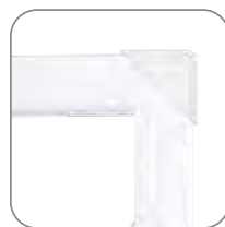
Транспортировочные уголки для металлических люков