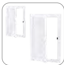
Большой ассортимент габаритов люков