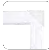
Транспортировочные уголки для металлических люков