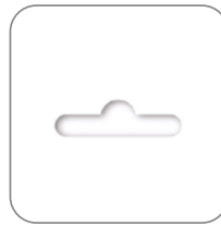
Розничная упаковка в пакете с еврослотом