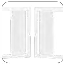
Открывание дверцы с правой или левой стороны