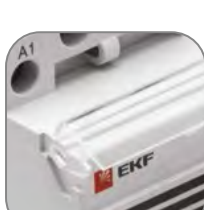
Маркировочная площадка с защитной крышкой