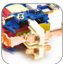
Мостиковый контакт обеспечивает быстрое гашение дуги при коммутации