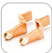
Серебросодержащий композит на контактах