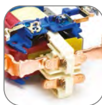
Мостиковый контакт обеспечивает быстрое гашение дуги при коммутации