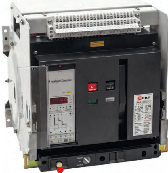
Рукоятка для выкатывания