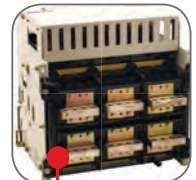
Главные контакты корзины