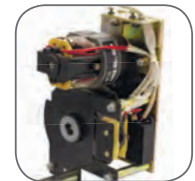
Электропривод взведения пружины