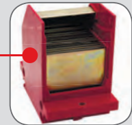
Неподвижный главный контакт