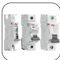
Полный набор аксессуаров