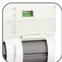
Удобное окно для маркировки цепи

Выключатели нагрузки AVN EKF AVERES являются механическими коммутационными аппаратами и применяются для оперативных включений и отключений в электрических цепях переменного тока. Выключатели предназначены для коммутации активных и индуктивных нагрузок, включая двигатели, уже защищенных другими коммутационными аппаратами.