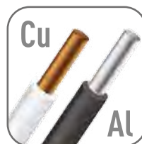
Возможна коммутация алюминиевым и медным проводом