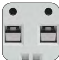
Защитные шторки на клеммах