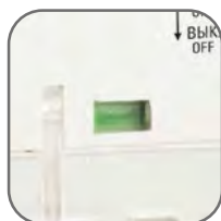
Окно реального состояния контактов с защитой от искр