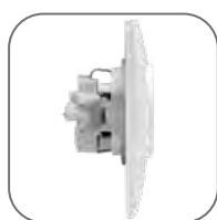
Низкая высота изделий