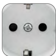
Адаптация к алюминиевому сплаву 8xxx серии