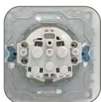
Основание из пластика, не поддерживающего горение

Современная коллекция, которая воплотила в себе функциональность и эстетику. «Валенсия» – очевидный выбор в экономсегменте за счет отличного сочетания низкой цены и высокого качества изделий. Помимо надежности и удобства монтажа, «Валенсия» предлагает все необходимые механизмы в сочетании со строгим и универсальным дизайном. Серия «Валенсия» доступна в шести цветовых решениях – классические белый и кремовый, а также жемчуг, графит, кашемир и сталь для реализации самых смелых дизайнерских идей.