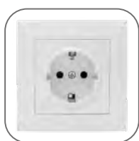
Корпус устойчив к ультрафиолетовому излучению