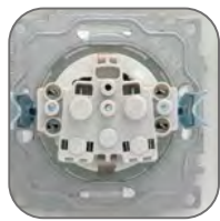
Основание из пластика, не поддерживающего горение

Современная коллекция, которая воплотила в себе функциональность и эстетику. «Валенсия» – очевидный выбор в экономсегменте за счет отличного сочетания низкой цены и высокого качества изделий. Помимо надежности и удобства монтажа, «Валенсия» предлагает все необходимые механизмы в сочетании со строгим и универсальным дизайном. Серия «Валенсия» доступна в шести цветовых решениях – классические белый и кремовый, а также жемчуг, графит, кашемир и сталь для реализации самых смелых дизайнерских идей.