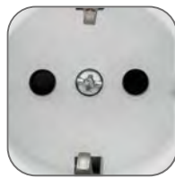
Адаптация к алюминиевому сплаву 8xxx серии