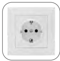
Корпус устойчив к ультрафиолетовому излучению