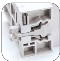
Двухпозиционный зажим на DIN-рейку