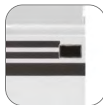
Индикатор состояния контактов