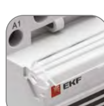
Маркировочная площадка с защитной крышкой