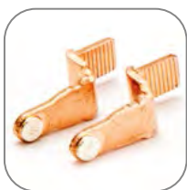
Серебросодержащий композит на контактах