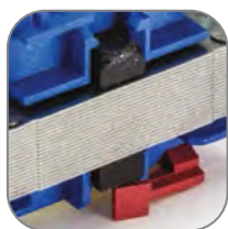
Резиновый демпфер уменьшает шум при работе

Контакт в классическом корпусе модульного оборудования. Состоит из неподвижных контактов, подвижных контактов, которые закреплены в подвижной части магнитной системы. Неподвижная часть магнитной системы закреплена жестко в корпусе KM. Пружина препятствует смыканию контактов. При подаче напряжения на катушку управления в магнитной системе контактора возникает магнитное поле, которое, преодолевая сопротивление пружины, смыкает магнитную систему и замыкает контакты. При отключении напряжения с катушки управления пружина размыкает контакты. Возможна коммутация алюминиевым и медным проводом.