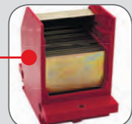
Неподвижный главный контакт