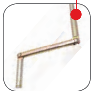
Ручьятка для выкатывания