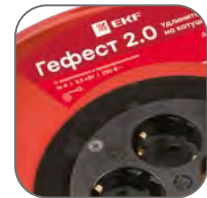
Катушка из металла толщиной 0,8–0,9 мм