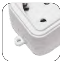
Крепление к стене