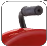
Рама из металлической трубы с резиновой рукояткой

Удлинитель на металлической катушке «Гефест 2.0» EKF PROxima могут использоваться на строительных площадках, для подключения энергоемких потребителей в гаражах и на приусадебных участках, в том числе сварочной аппаратуры, перфораторов, электропил. Надежный кабель КГ в резиновой изоляции выдержит как механические нагрузки, так и суммарную мощность подключенных потребителей до 3,5 кВт.