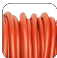
Гибкий надежный проводник ПВС. Длина: 30, 40, 50 м