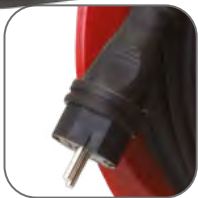
Каучуковая разборная вилка