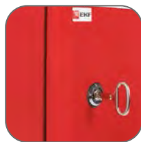
Качественный сварной корпус