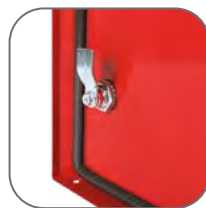
Герметичный уплотнитель на дверце и пыле-влагозащитный замок