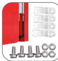
Пластины для навесного монтажа