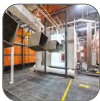
Атмосферостойкая порошковая краска RAL 3001

Щиты с монтажной панелью ЩМПг RAL 3001 EKF PROxima являются надежной оболочкой для сборки щитов пожарной автоматики. Наличие полноразмерной оцинкованной монтажной панели в стандартной комплектации позволяет собирать щиты управления пожарными насосами и щиты пожарной сигнализации любой сложности. Возможна установка модульного и силового оборудования, а также вывод аппаратуры управления на дверь щита. Электрощиты окрашены атмосферостойкой порошковой краской в красный цвет.