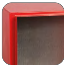
Скошенный желоб препятствует попаданию влаги внутрь