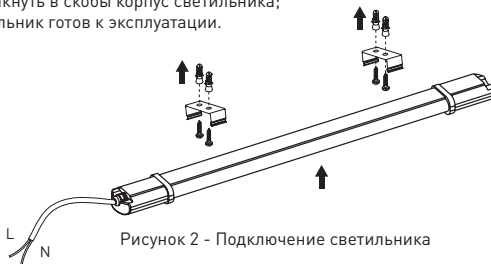
Рисунок 2 - Подключение светильника