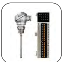
Подключение датчиков температуры