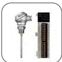
Подключение датчиков температуры