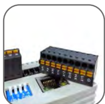
Съемные пружинные клеммы