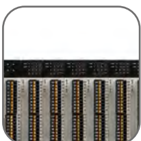
Расширение до 256 точек ввода/вывода