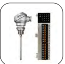
Подключение датчиков температуры