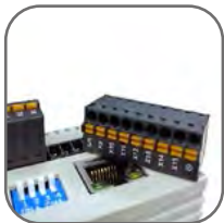
Съемные пружинные клеммы