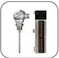
Подключение датчиков температуры