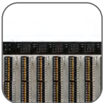
Расширение до 256 точек ввода/вывода