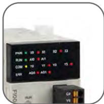
Индикация состояния входов/выходов

Свободно программируемые устройства для АСУТП, предназначенные для выполнения логических операций по заданной программе. Предназначены для повышения энергоэффективности, безопасности и цифровизации предприятий всех сфер промышленности. Применяются для автоматизации распределения электроэнергии, отопления, вентиляции, кондиционирования, металлообработки, деревообработки, водоподготовки, водоотведения, конвейеров, упаковочных линий и т.д.