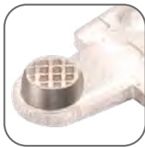
Рифленая поверхность доп. контактов для присоединения с целью увеличения токопроводности и надежности соединения