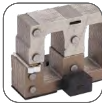
Сердечник выполнен из высококачественной электротехнической стали, что позволяет катушке надежно удерживать контакты во включенном состоянии при нормальном напряжении катушки управления