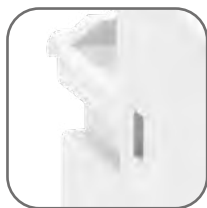
Корпус и подвижная траверса выполнены из термостойкой пластмассы

Контакты КМЭп PROxima состоят из корпуса, закрепленных в нем неподвижных контактов, подвижных контактов, которые закреплены в подвижной части магнитной системы. Неподвижная часть магнитной системы закреплена жестко в корпусе КМЭп. Пружина препятствует смыканию контактов. При подаче напряжения на катушку управления в магнитной системе контактора возникает магнитное поле, преодолевая сопротивление пружины, смыкает магнитную систему и замыкает контакты. При отключении напряжения с катушки управления пружина размыкает контакты. Возможна коммутация алюминиевым и медным проводником.