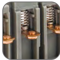
Самопозиционирующиеся подвижные контакты. Они могут качаться, подпружинены и имеют сферическую поверхность. Возможна коммутация алюминиевым и медным проводником