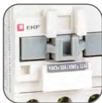
Маркировочная площадка в комплекте для идентификации контакторов в щите