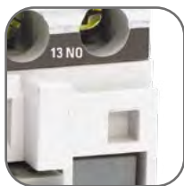
Наличие доп. контактов для организации автоматизации