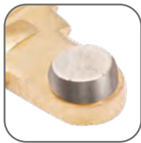
Высокая коммутационная износостойкость Серебросодержащий композит на контактах обеспечивает низкое переходное сопротивление и высокую сопротивляемость разрушению при коммутации