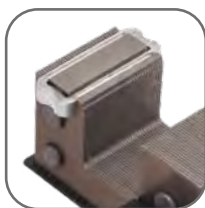
Сердечник магнитной системы с уменьшенными вихревыми потерями