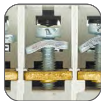
Тарельчатые зажимы для надежного присоединения проводников