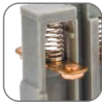
Мостиковый контакт создает условия для быстрого гашения дуги