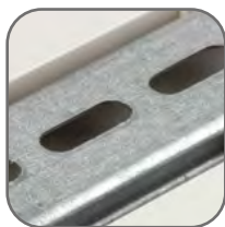
Возможность установки как на DIN-рейку, так и на монтажную панель