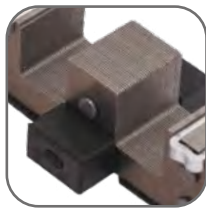
Магнитная система оснащена резиновыми демпферами, что уменьшает шум при работе