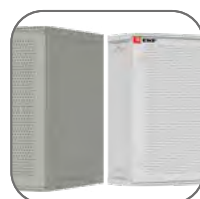
Наличие сварных и разборных вариантов исполнения