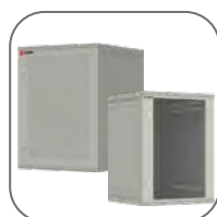
Широкая гамма типоразмеров