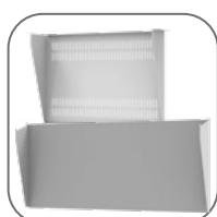
Наличие дополнительных аксессуаров