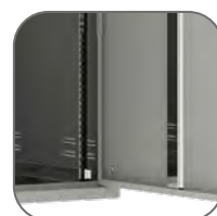
Конструкция петель позволяет демонтировать или перевесить переднюю дверь в другую сторону