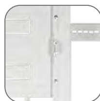
Магнитная защелка – свободный доступ жильцов к автоматам