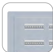
Установка заподлицо со стеной

Корпуса щитов этажных серии ЩЭ EKF BASIC предназначены для приема, поквартирного распределения и учета электроэнергии, а также защиты групповых линий квартир при перегрузках и коротких замыканиях. Для размещения устройств телефонной, радиотрансляционной, телевизионной аппаратуры и других слаботочных систем. Поставляются в собранном виде. Имеют сварную конструкцию с несъемной монтажной рамой. Щиты шинами и ответвительными сжимами «Орех» не комплектуются.