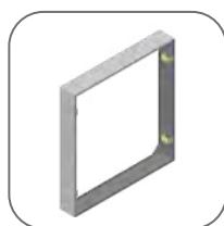
Навесной монтаж при помощи кожуха