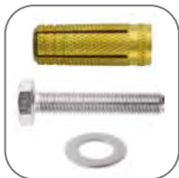
Широкий ассортимент крепежа