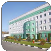
Наука и образование