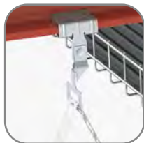
Зажим балочный под перфоленту