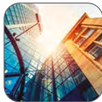
ТЦ, БЦ, вокзалы, аэропорты, офисы