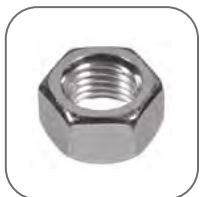
Высокое качество крепежа и метизов