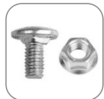
Удобная кратность упаковок