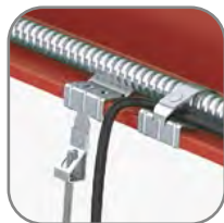
Зажим балочный с резьбой М6

Универсальный балочный зажим с отверстием диаметром 6 мм предназначен для организации системы подвесов с помощью металлических тросов, болтовых соединений с резьбой М6 и меньше, а также иных вариантов опусков.