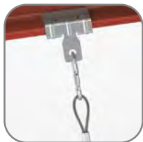
Универсальный балочный зажим