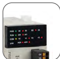
Индикация состояния входов/ выходов

Свободно программируемые устройства для АСУТП, предназначенные для выполнения логических операций по заданной программе. Предназначены для повышения энергоэффективности, безопасности и цифровизации предприятий всех сфер промышленности. Применяются для автоматизации распределения электроэнергии, отопления, вентиляции, кондиционирования, металлообработки, деревообработки, водоподготовки, водоотведения, конвейеров, упаковочных линий и т.д.