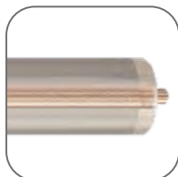
Сечение токопроводящих жил

Кабели саморегулирующиеся применяются для систем антиобледенения кровель и водостоков, водопроводных труб и кранов, канализационных труб, накопительных баков, ливневых канализаций, труб систем пожаротушения и крыш. Нагревательный кабель рассчитан на работу от бытовой электросети с напряжением 230 В и частотой 50 Гц.