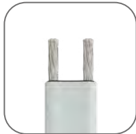
Материал токопроводящих жил – никелированная медь. Матрица не отслаивается от жил