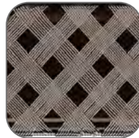
Сечение экрана составляет не менее 1 мм 2 , плотность не менее 60 %