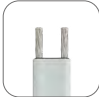
Материал токопроводящих жил – никелированная медь. Матрица не отслаивается от жил