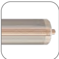
Сечение токопроводящих жил

Кабели саморегулирующиеся применяются для систем антиобледенения кровель и водостоков, водопроводных труб и кранов, канализационных труб, накопительных баков, ливневых канализаций, труб систем пожаротушения и крыш. Нагревательный кабель рассчитан на работу от бытовой электросети с напряжением 230 В и частотой 50 Гц.