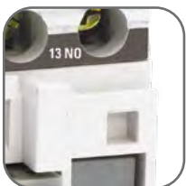
Наличие дополнительных контактов для организации автоматизации