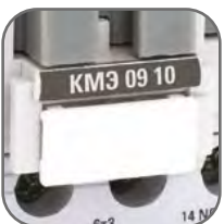
Маркировочная площадка в комплекте для идентификации контакторов в щите