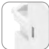
Корпус и подвижная траверса выполнены из термостойкой пластмассы, не поддерживающей горение

Контакты КМЭ EKF PROxima состоят из корпуса, закрепленных в нем неподвижных контактов, подвижных контактов, которые закреплены в подвижной части магнитной системы. Неподвижная часть магнитной системы закреплена жестко в корпусе КМЭ. Пружина препятствует смыканию контактов. При подаче напряжения на катушку управления в магнитной системе контактора возникает магнитное поле, которое, преодолевая сопротивление пружины, смыкает магнитную систему и замыкает контакты. При отключении напряжения с катушки управления пружина размыкает контакты. Возможна коммутация алюминиевым и медным проводом.