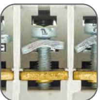
Тарельчатые зажимы для надежного присоединения проводников