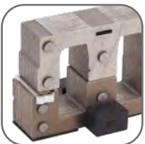
Сердечник выполнен из высококачественной электротехнической стали, что позволяет удерживать контакты во включенном состоянии при нормальном напряжении катушки управления