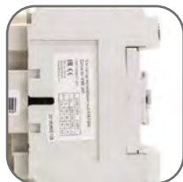
Высокая коммутационная стойкость