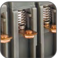
Самопозиционирующиеся подвижные контакты. Они могут качаться, подпружинены и имеют сферическую поверхность. Мостиковый контакт создает условия для быстрого гашения дуги