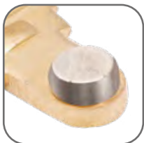
Высокая коммутационная износостойкость. Серебросодержащий композит на контактах обеспечивает низкое переходное сопротивление и высокую сопротивляемость разрушению при коммутации