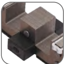
Магнитная система оснащена резиновыми демпферами, что уменьшает шум при работе