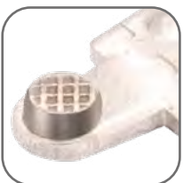
Рифленая поверхность дополнительных контактов для присоединения с целью увеличения токопроводности и надежности соединения