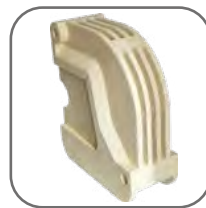
Сменные крышки дугогасительных камер из небьющегося ДМС пластика (без асбеста)