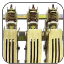
Трехполюсное исполнение на ток от 100 до 630 А

возникает магнитное поле, которое, преодолевая сопротивление пружины, смыкает магнитную систему и замыкает контакты. При отключении напряжения с катушки управления пружина размыкает контакты. Возможна коммутация алюминиевым и медным проводом.