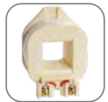
Съемные катушки управления