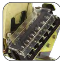
Конструкция крышек обеспечивает свободный доступ к силовым контактам