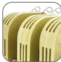
Естественное воздушное охлаждение