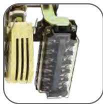
6 перенастраиваемых пользователем дополнительных контактов