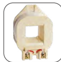
Съемные катушки управления