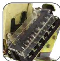
Конструкция крышек обеспечивает свободный доступ к силовым контактам