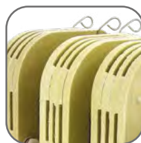
Естественное воздушное охлаждение