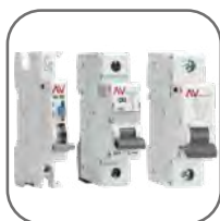
Полный набор аксессуаров